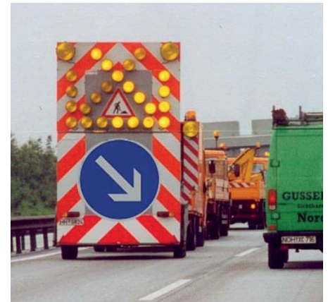
Bild 8: Fahrbare Absperrtafel (Zeichen 616-30 VzKat 2017) mit integriertem Zeichen 222

als irrig erwiesen. Auch auf Landstraßen kann deshalb das Zeichen 616 in der kleinen Variante (Zeichen 616-31 VzKat 2017) bedenkenlos eingesetzt werden.