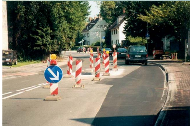
Bild 6: Falsche und irreführende Wegweisung im Bereich einer Umleitungsstrecke