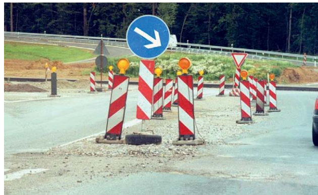
Bild 5: Ungewöhnliche Situationen können Zeichen 222 dennoch erfordern