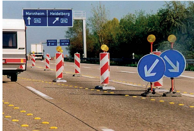
Bild 4: Die schon immer in Deutschland unzulässige Anwendung der Zeichen 222 (s. Rn. 3 VwV-StVO zu Zeichen 222)

Grundsätzlich ist das Zeichen im Ausnahmefall ein Hilfsmittel, um die richtige Seite zur Umfahrung eines Hindernisses erkennen zu können (Bild 5) und keine „Wegweisung“ (Bild 6). Somit ist künftig die Führung in Arbeitsstellen möglichst ohne das Zeichen