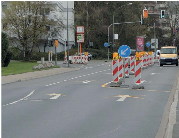
Bild 2: Gemäß VwV-StVO nicht mehr zulässige Anordnung von Zeichen 222

Die deutliche Führung des Straßenverkehrs im Bereich einer Arbeitsstelle erfolgte zunächst vorrangig mit rot-weiß gestreiften Absperrschranken. Allerdings war das Vertrauen in die sichere Erkennbarkeit einer solchen Spurführung insbesondere auf Autobahnen bei den Verantwortlichen nicht sehr hoch, sodass z. B. bei Überleitungen das Zeichen 222 (Vorgeschriebene Vorbeifahrt) mehrfach hintereinander eingesetzt wurde (Bild 1). Erst die VwV-StVO 2009 hat nun die Anwendung des Zeichens 222 stark eingegrenzt: Es soll nur noch in besonders kritischen Situationen angeordnet werden.